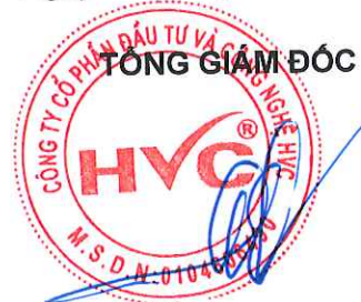
Đỗ Huy Cường