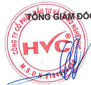
Đỗ Huy Cường